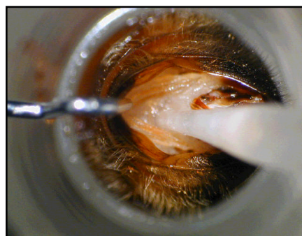
Wprowadzanie nasienia do komory kopulacyjnej