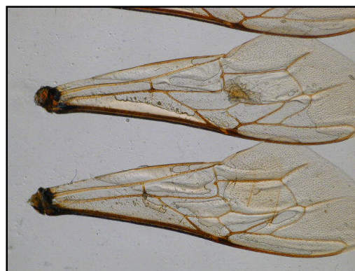
Skrzydła pszczoły do oceny morfologicznej