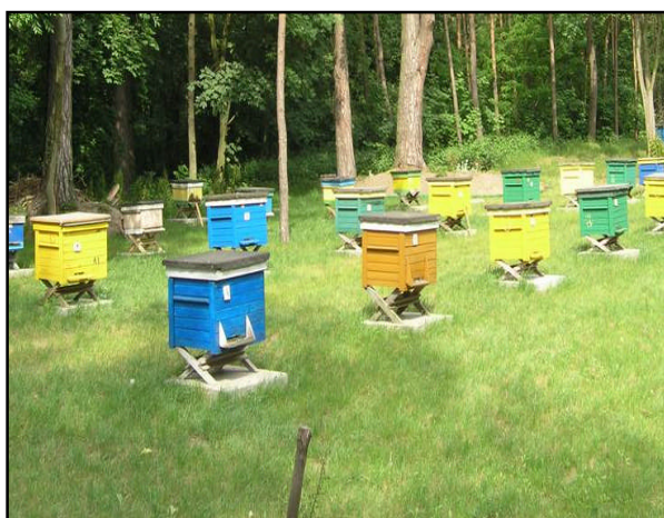
Pasieka hodowlana OPISK