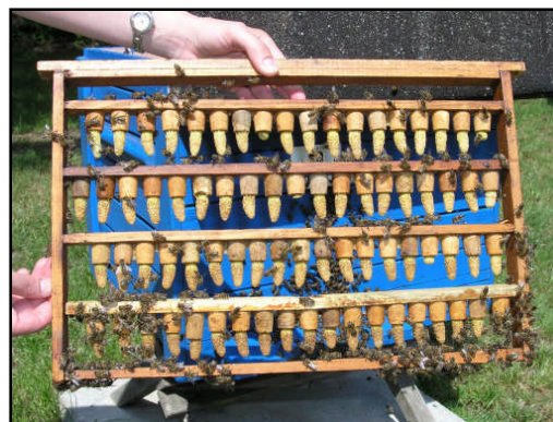
Ramka hodowlana z matecznikami