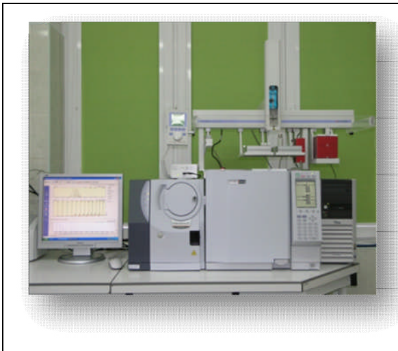
Chromatograf gazowy z detektorem masowym (GC-MS)